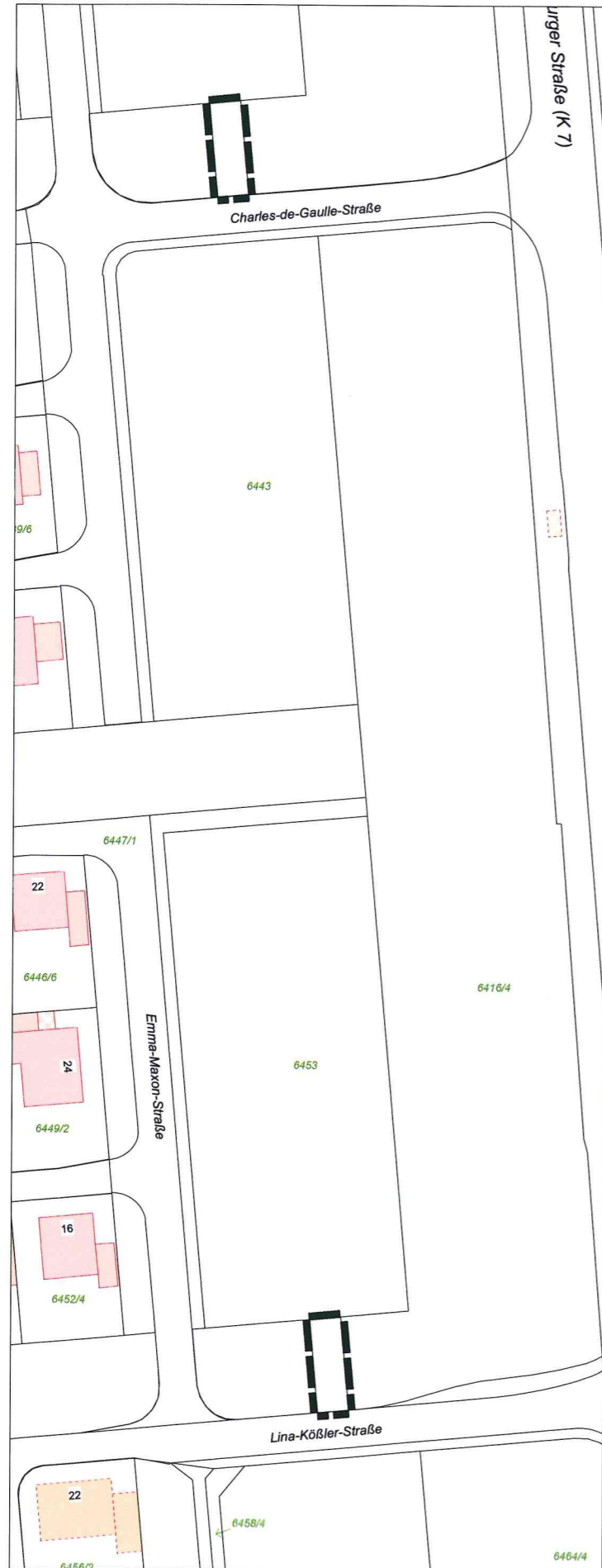
Räumlicher Geltungsbereich - Aufstellungsbeschuß