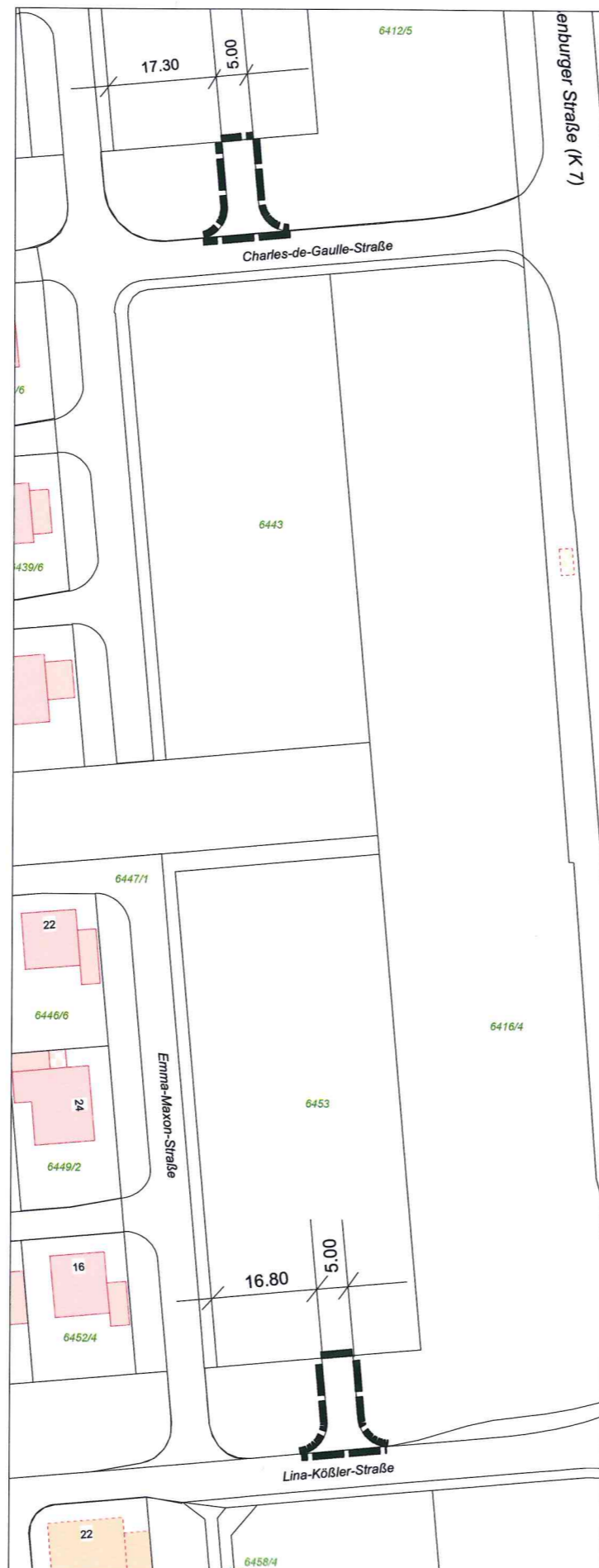
Räumlicher Geltungsbereich - Entwurfsbeschuß