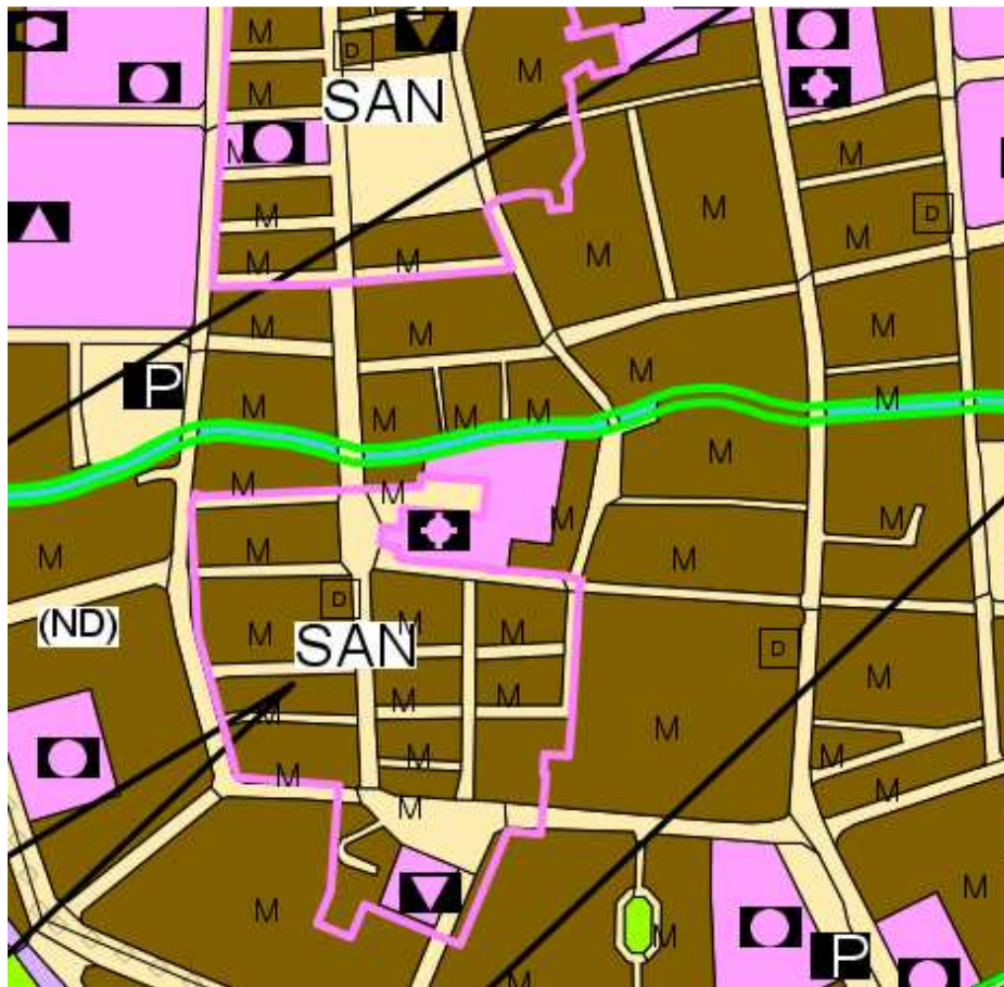
Abbildung 2: Darstellung im Flächennutzungsplan